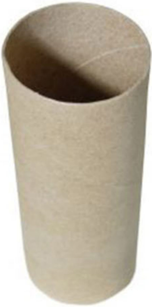
Tubo de papel