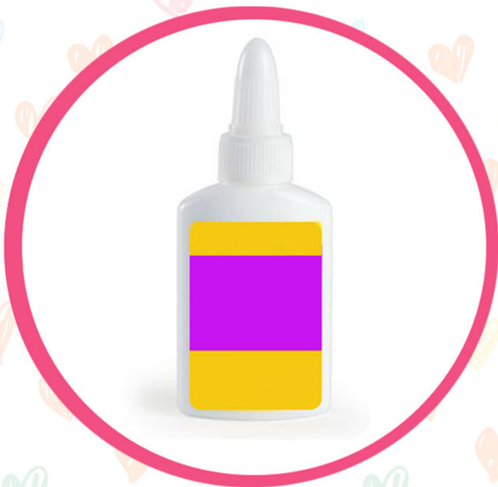
PEGAMENTO DE FIELTRO