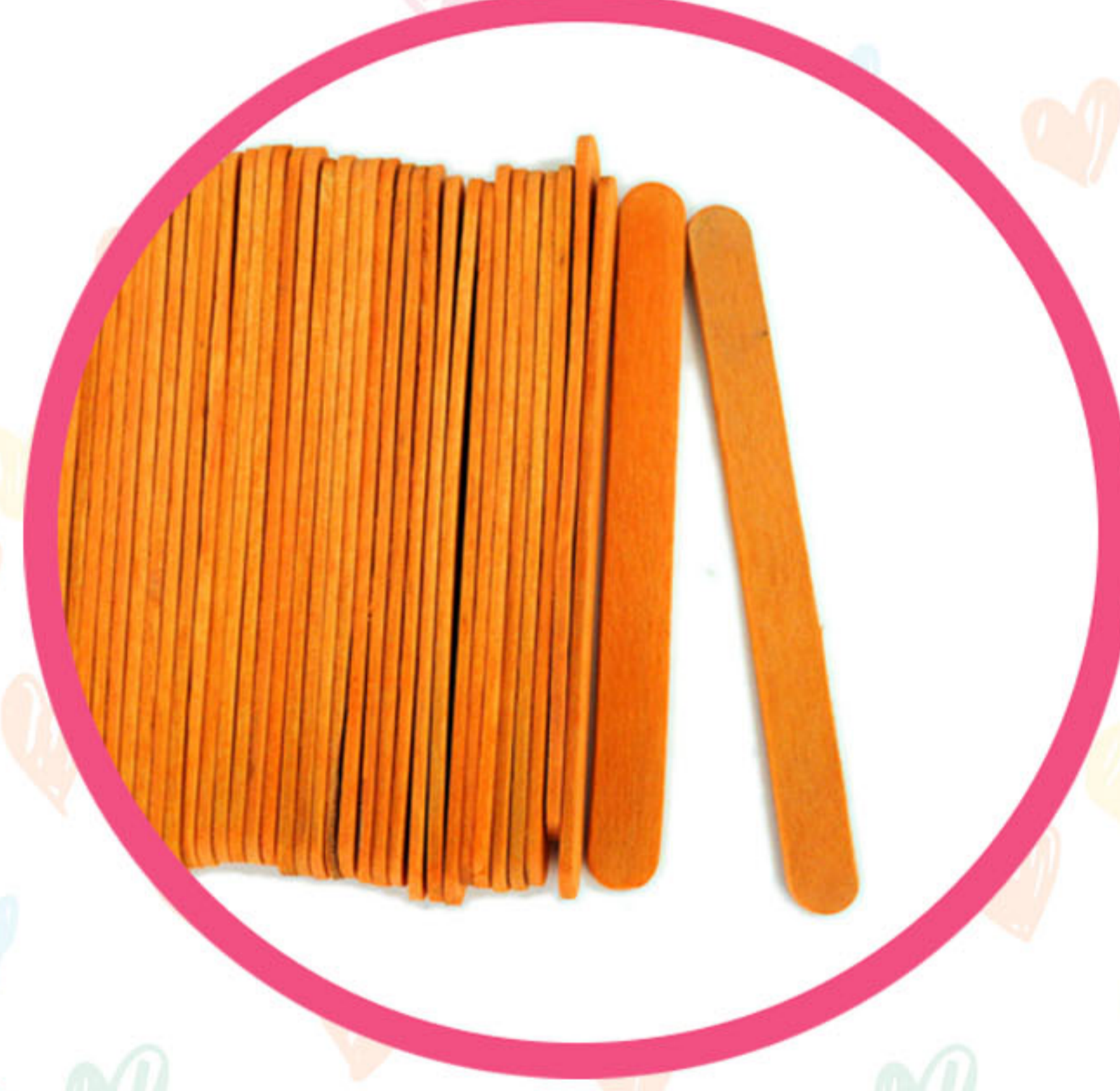
PALITO DE HELADO