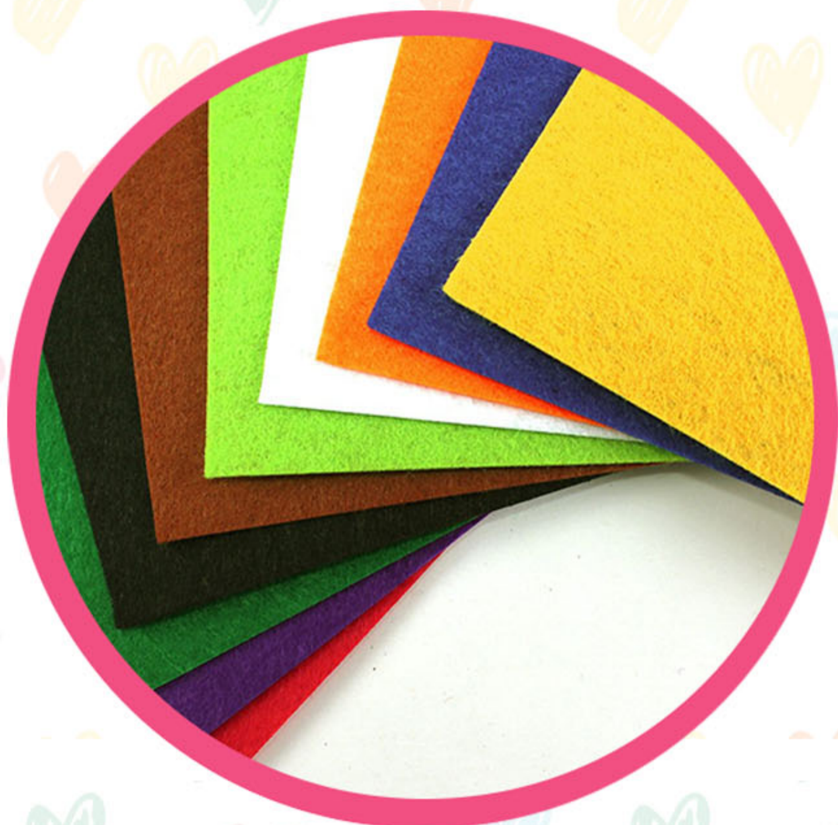
TELA DE FIELTRO