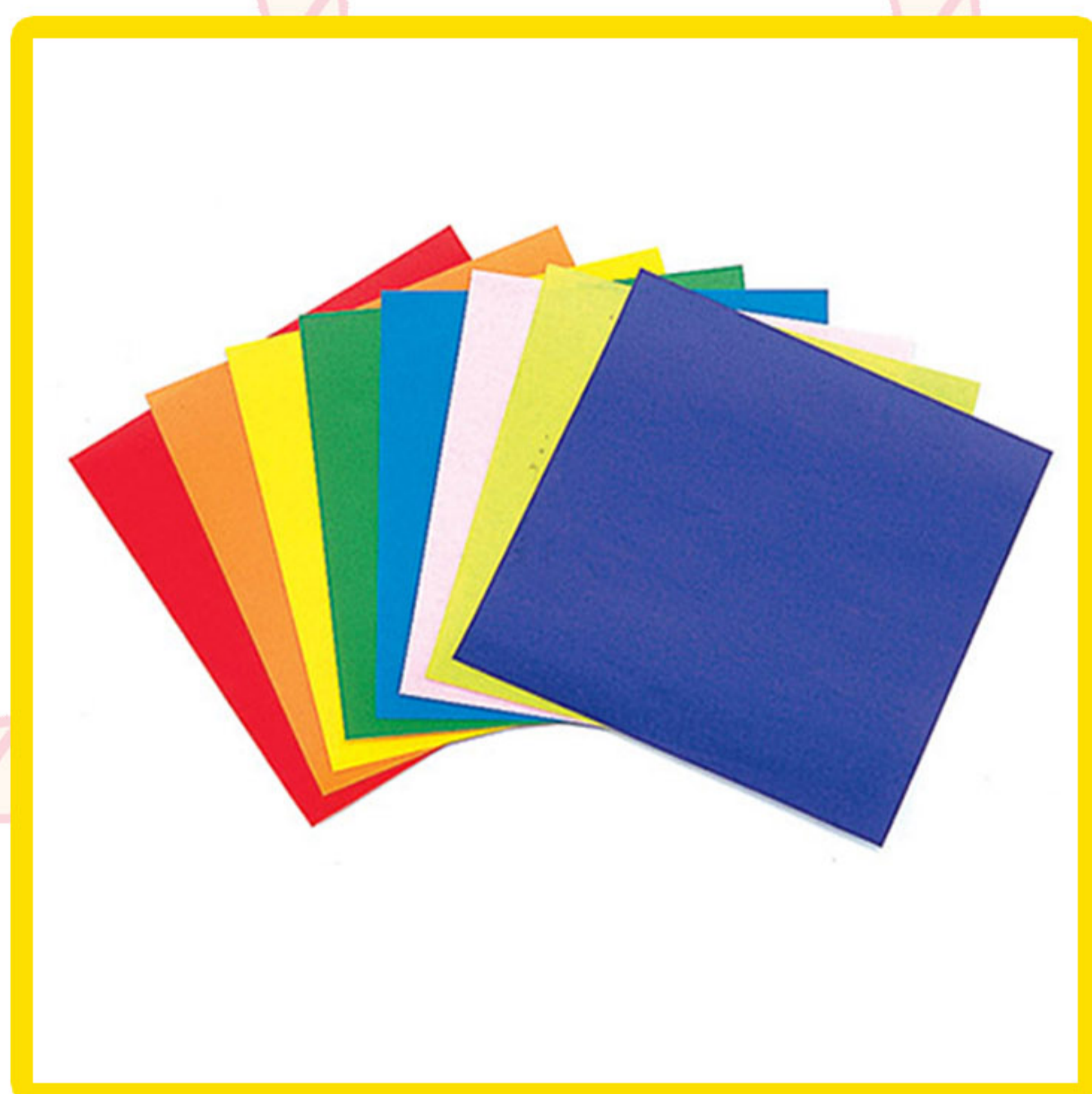
Papel de color