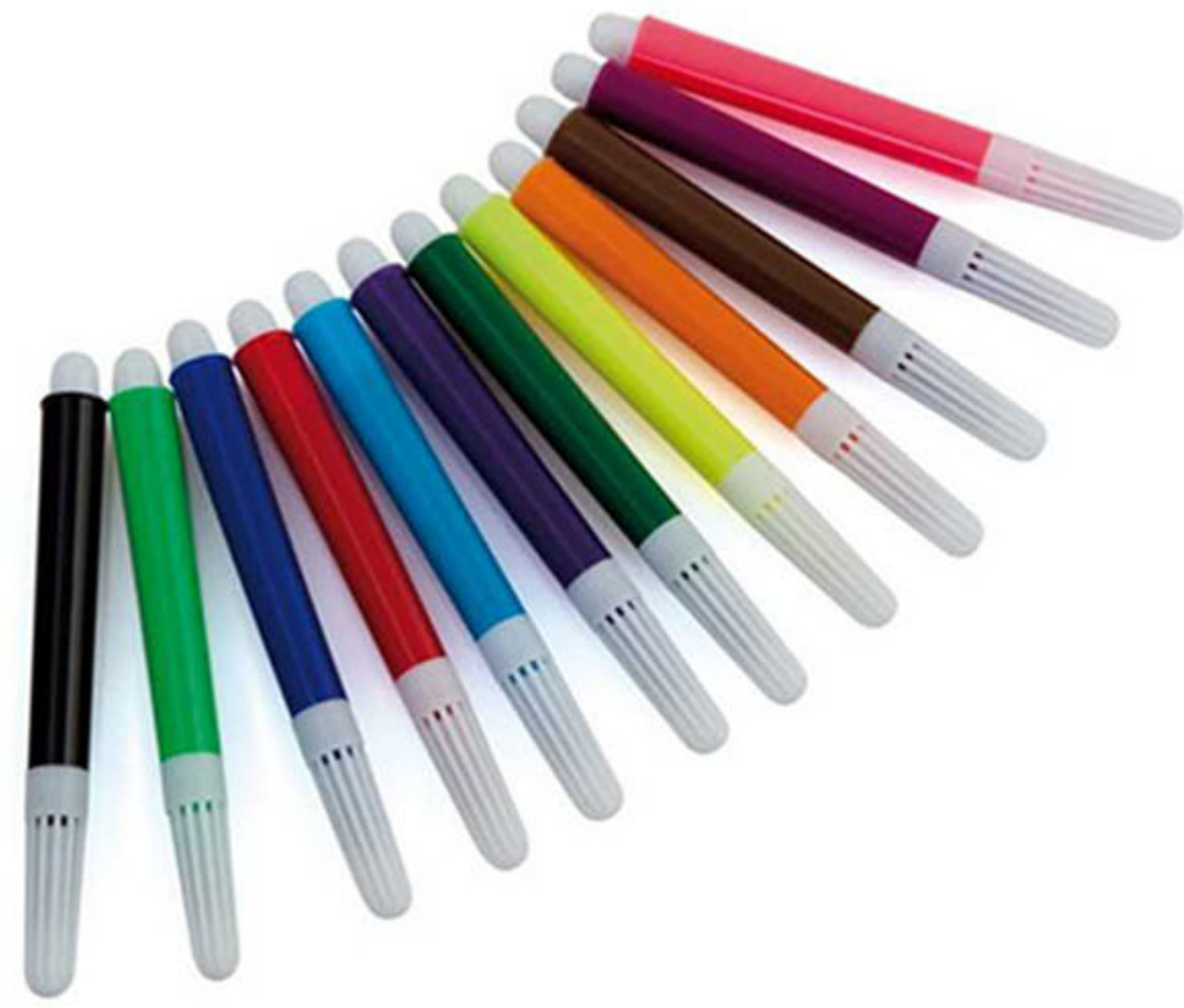
Bolígrafos de colores