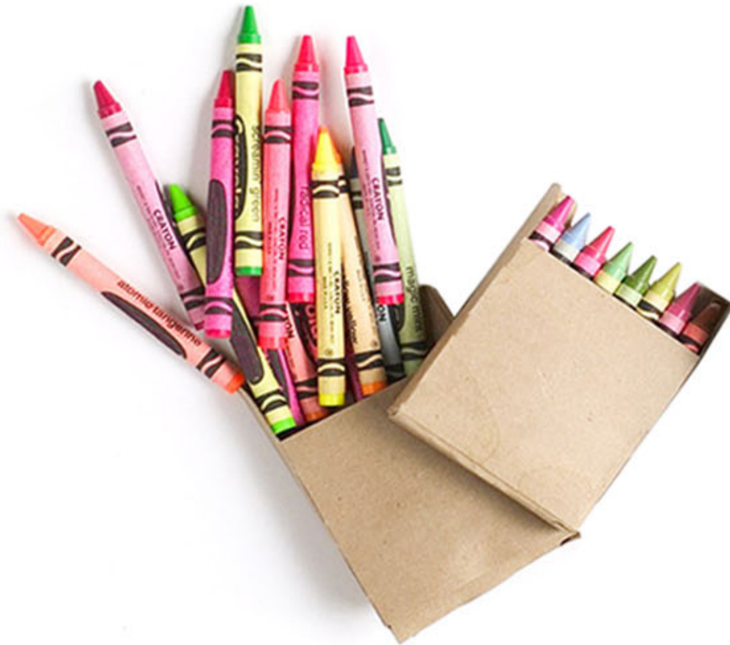
Lápices de color