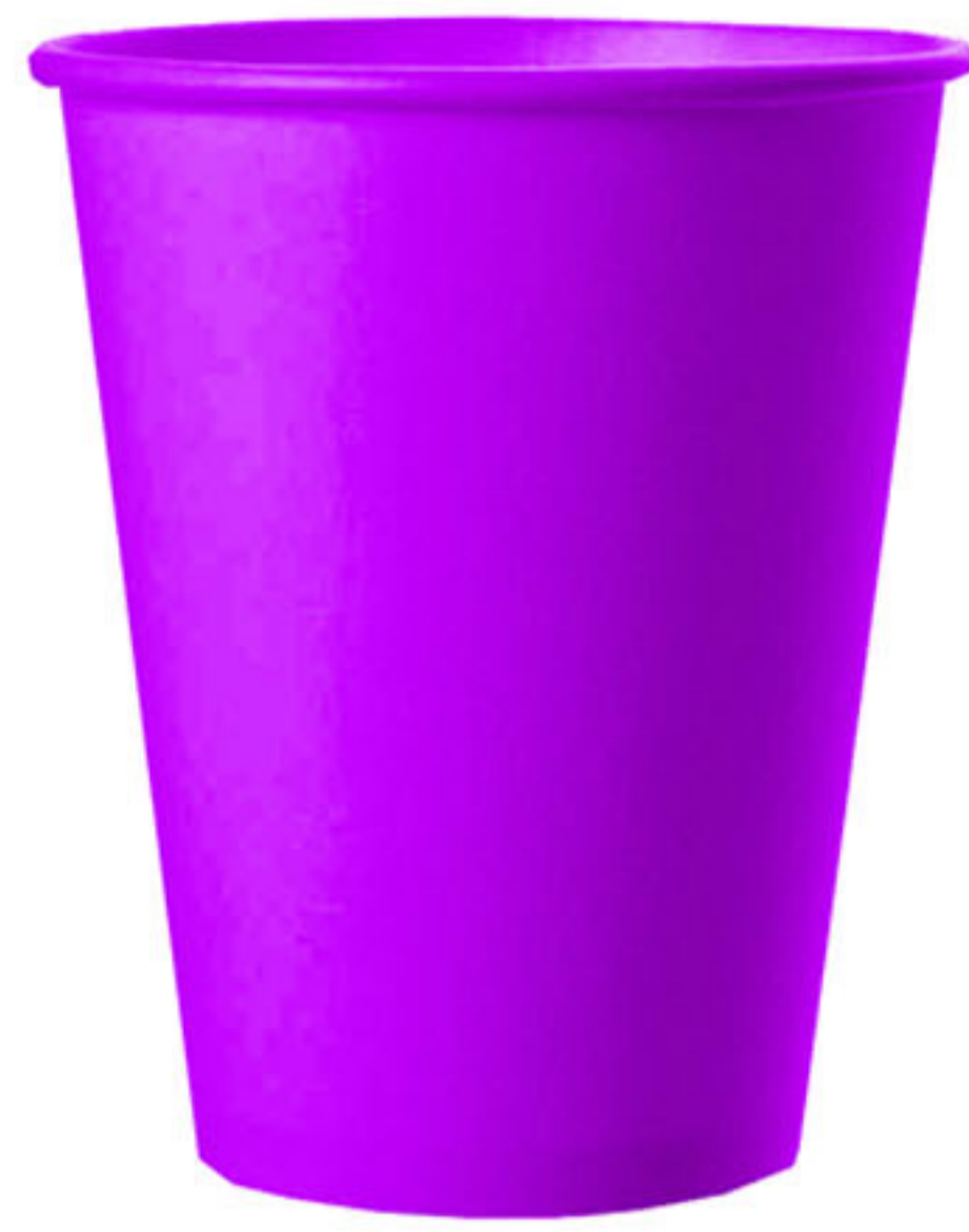
Vaso de papel