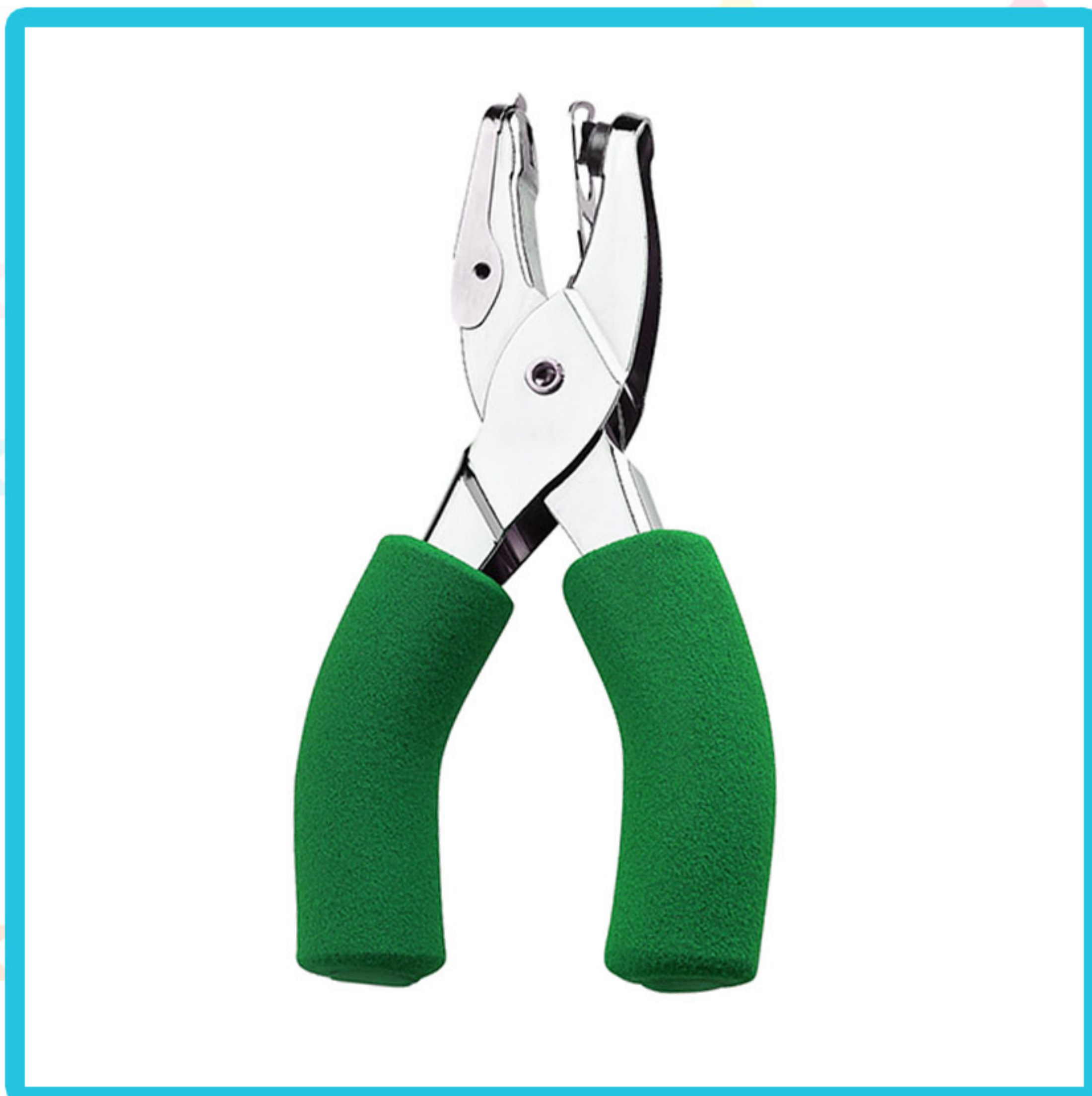
Perforación de agujeros