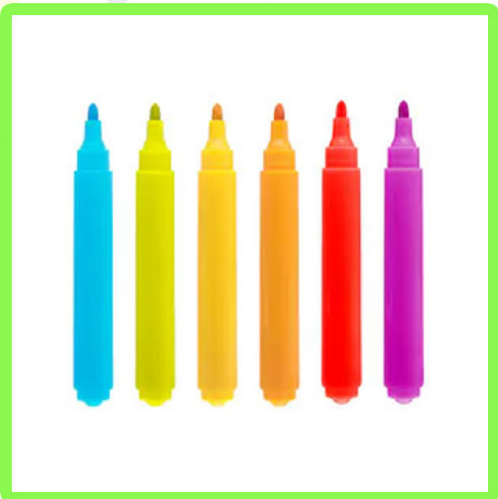
Bolígrafos de colores