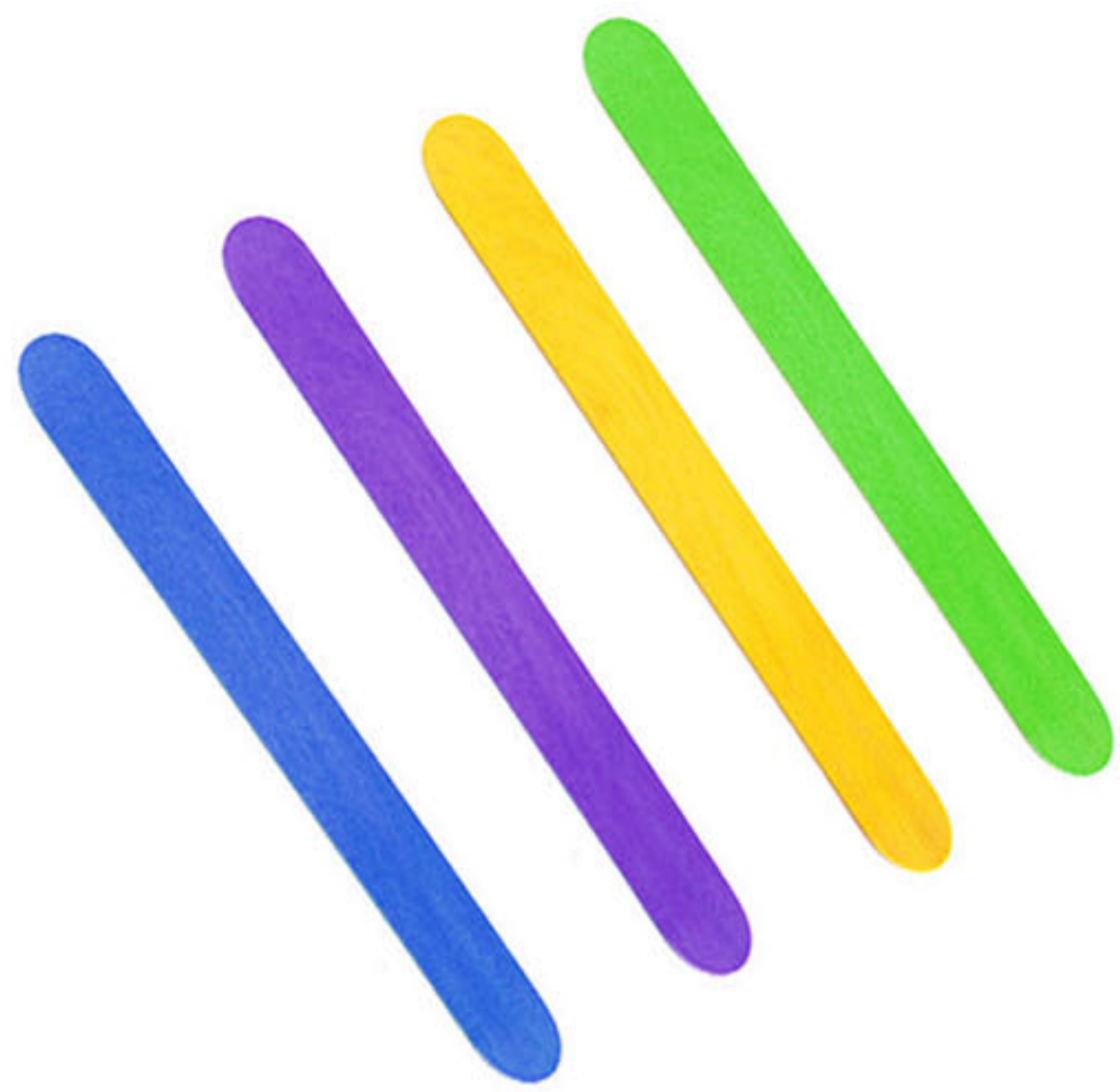
Palitos de chupetín