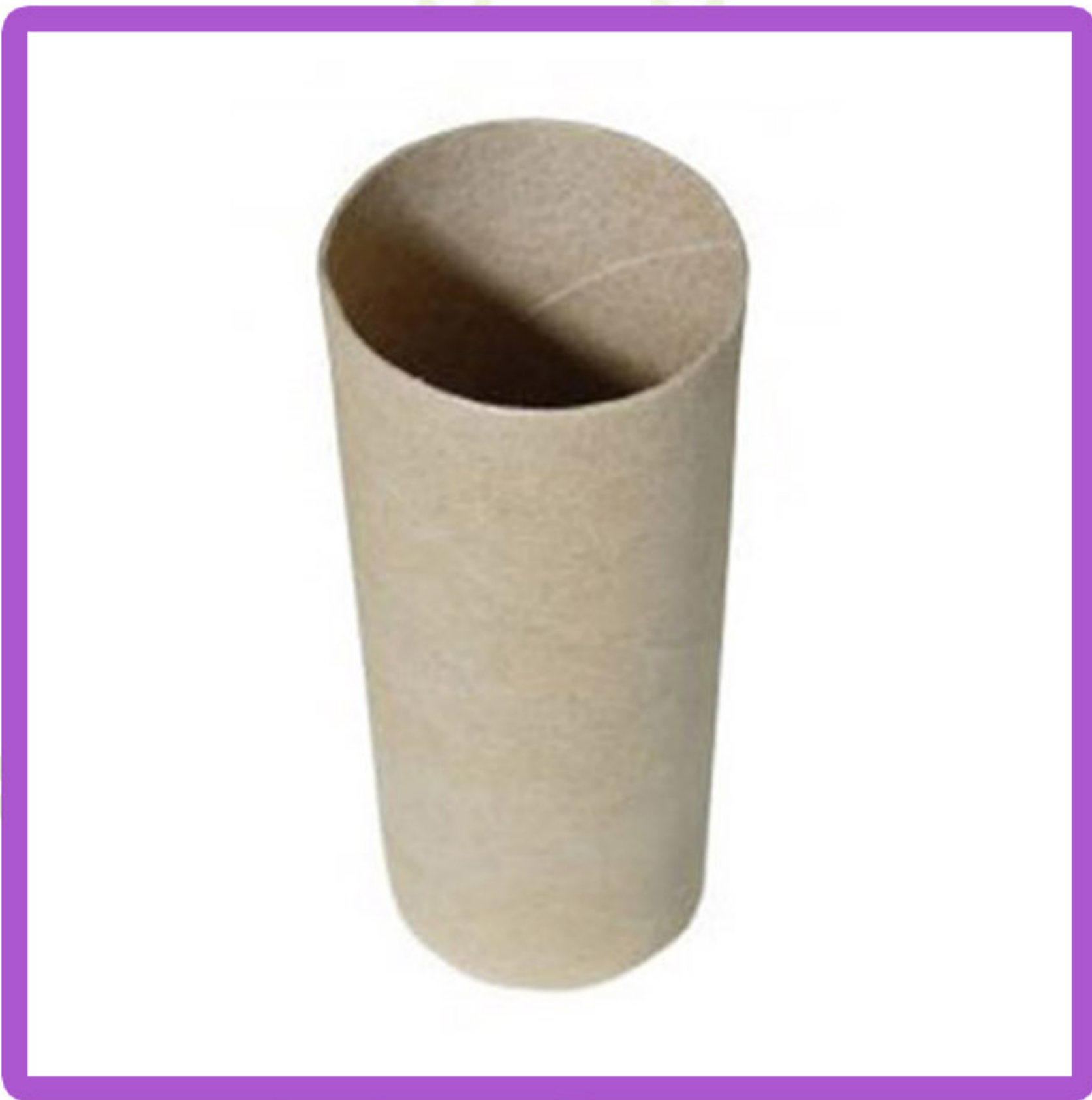
Tubo de papel