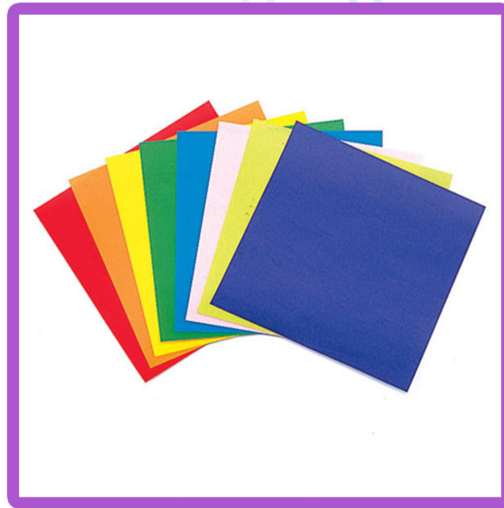
Papel de color