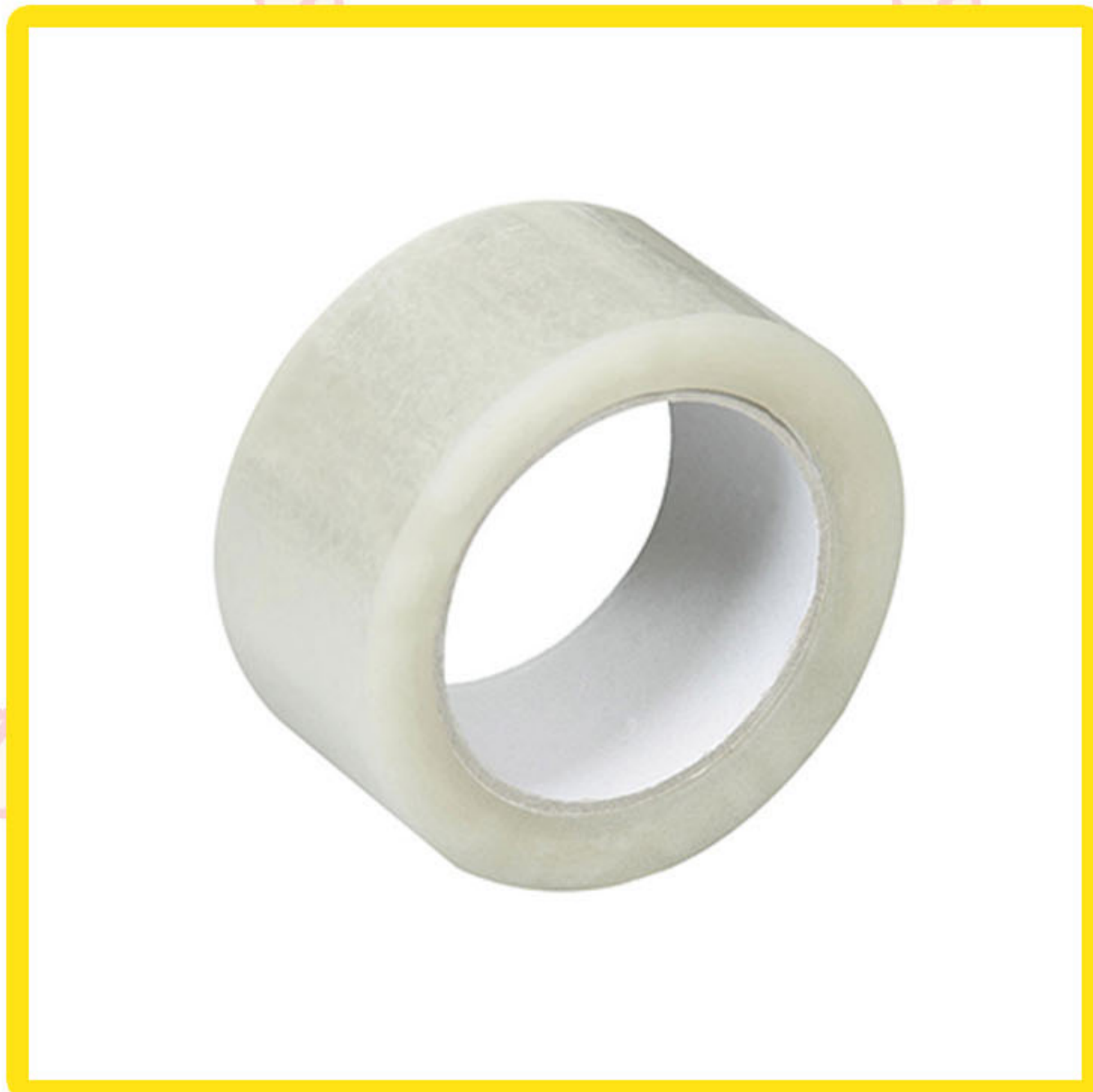
Cinta adhesive transparente