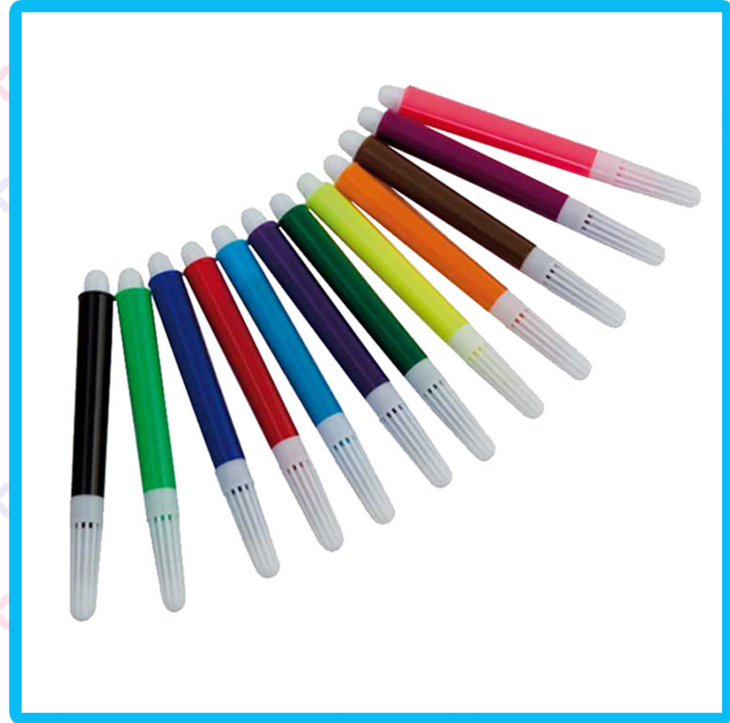
Bolígrafos de colores